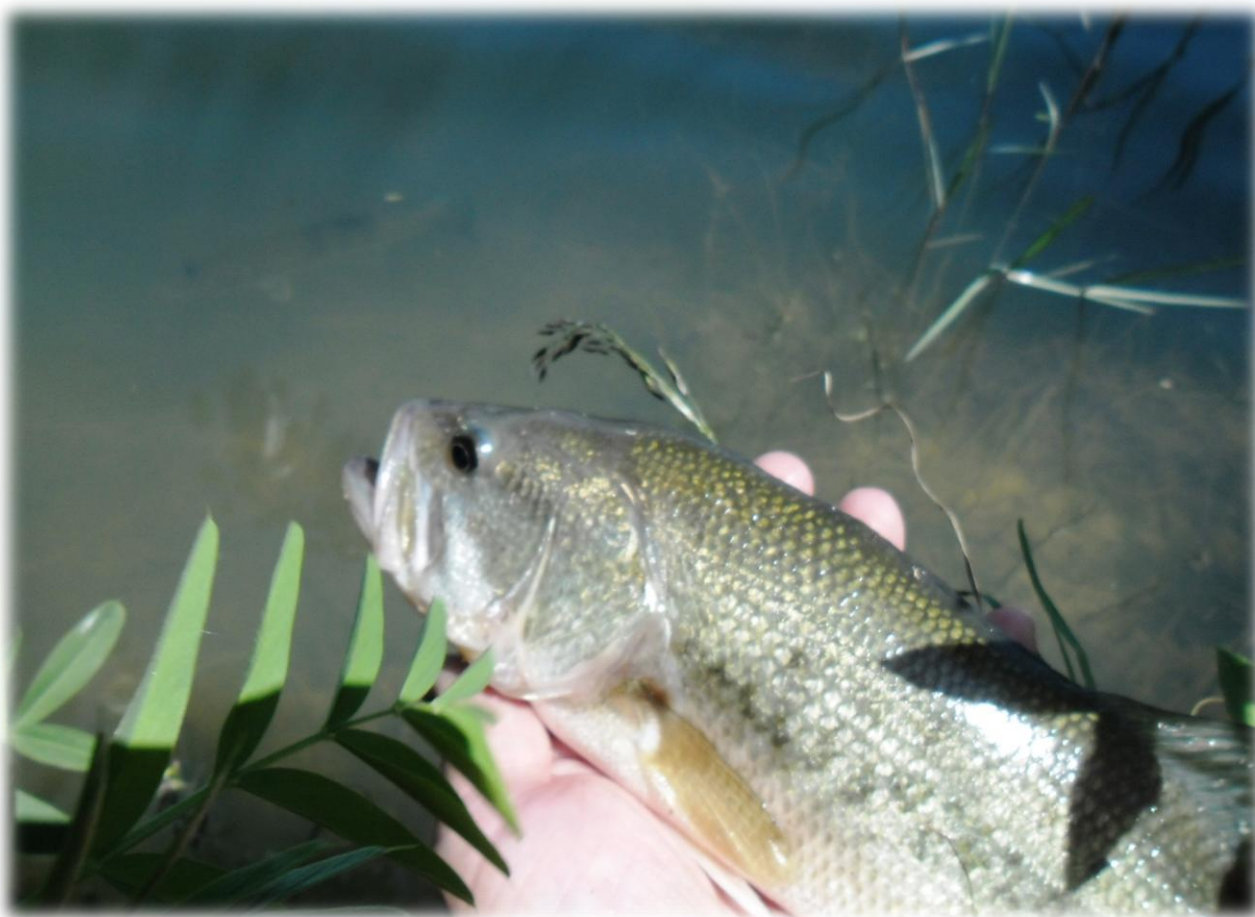
Empoisonnement du lac de Boueilh-Boueilho-Lasque en Black Bass, produits dans notre bassin RNA (Reproduction Naturelle Aménagée)

L'AAPPMA dispose de trois plans d'eau pour la production de poissons blancs et de carnassiers. Chaque année des vidanges sont réalisées afin d'aleviner les 15 lacs que nous avons en gestion. Suivant les besoins et les différentes études réalisées par nos techniciens, nous produisons soit : du brochet, du black bass, du sandre, du gardon, mais aussi de la tanche ou du rotengle. Une tonne de poissons est ainsi lâchée tous les ans.